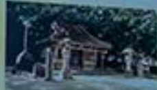
かつての天川御嶽の社殿。平成9年(1997)撮影 Shrine of the Amā-on Sacred Site (December 1996)